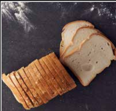
Glutenvrij wit brood € 4,99 per stuk