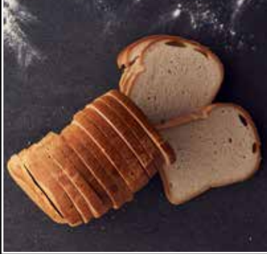
Glutenvrij bruin brood € 4,99 per stuk