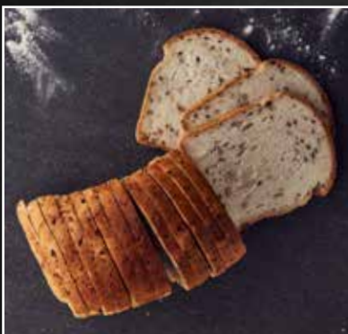
Glutenvrij meerzaden brood € 4,99 per stuk